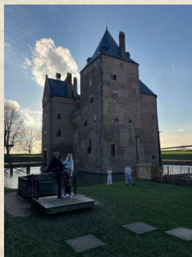
Learning about Dutch history at Slot Loevestein